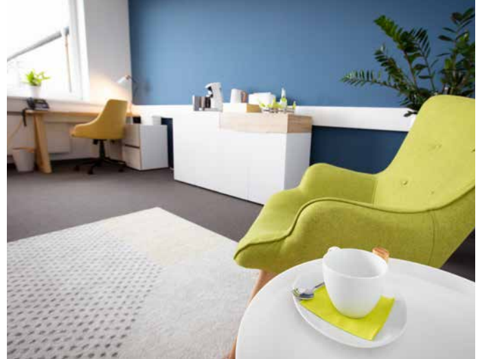
So lässt es sich entspannt und doch konzentriert arbeiten: Blick in den Büsumer Coworking Space im mariCUBE.

Die technische Ausstattung, die zukünftig mit genutzt werden kann, ist vom Feinsten. Sie reicht von einer Videowall über eine Kamera für Streamingaufnahmen bis zu diversen Kamera- und Soundsystemen, die bei der Erstellung von Podcasts und Videoaufnahmen zum Einsatz kommen. Aufgrund der Digitalisierung